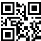
Anzahl der gescannten Barcodes ausgeben (nur im Inventurmodus)