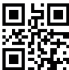
Ripristina le impostazioni di fabbrica